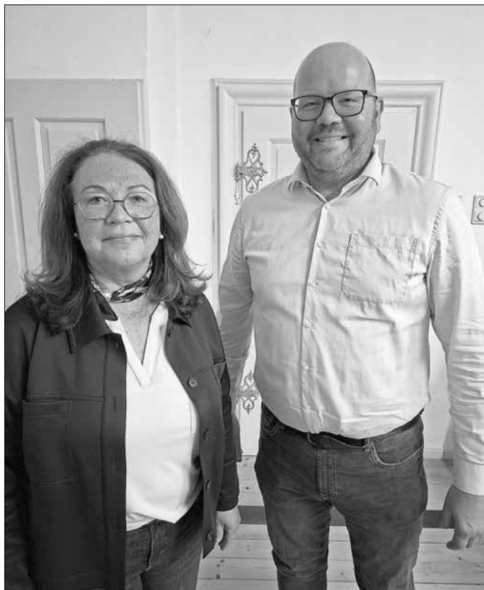
2. Bürgermeister Rainer Birklein