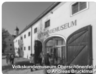
Volkskundemuseum Oberschönenfeld