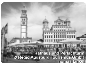
Rathaus und Perlachturm