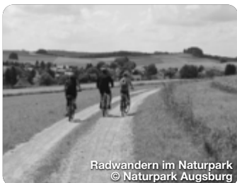
Radwandern im Naturpark

TreffpunktDeutschland.de/augsburger-land